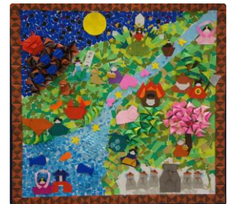
高根沢町 児童館きのこのもり 「英雄 by きのこのもり」