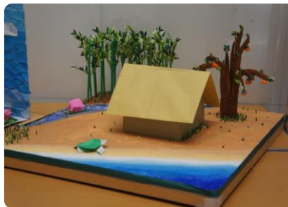
栃木市 さくら3Jホール 「誰の家？」