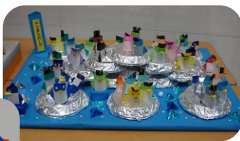
足利市 梁田こども館 「やなだパーク 【ペンギンパーク・観覧車・ひまわり】」