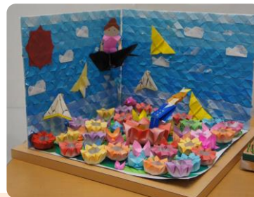
益子町 やわらぎ児童館 「～おやゆびひめ～」