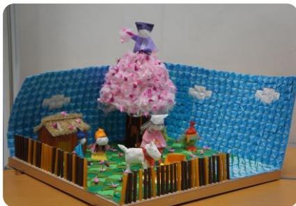
高根沢町 児童館みんなのひろば 「ひろばのさくらはなさかじいさん」

今年度はテーマ部門（むかしばなし）に加え、フリー部門も新設し、6つの児童館が参加しました。子どもたちのアイデアを具現化できるよう、先生方にご支援いただき、各児童館ならではの作品が並びました。参加児童館の皆さまの多大なるご協力を心より感謝申し上げます。次年度もたくさんの児童館の参加をお待ちしております。