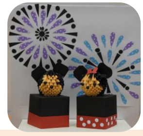
野木町 あかつか児童センター 「ミッキー&ミニー」