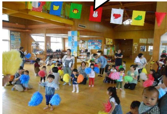
子育て教室 ミニ運動会