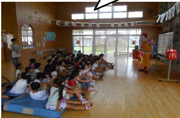
マクドナルド防犯教室