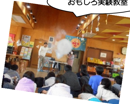
おもしろ実験教室