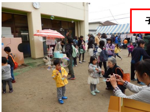
子どもフェスティバル

大平児童館は、栃木市大平町蔵井にある小型児童館です。周辺には、図書館や体育館・運動公園があります。施設は3階建ての建物で、1階には図書室・遊戯室、2階には集会室、3階には天体観測室があります。また、お庭には遊具もあり、子どもたちは自分の好きな場所で自由に遊んでいます。金曜日の夜には天体観測会を開催し、平日には乳幼児向けの親子教室、週末や長期休暇中には小学生向けの料理教室や理科教室などを開催しています。その他、秋には子どもフェスティバルと題して、乳幼児から大人まで楽しめるお祭りを盛大に開催しています。