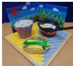
益子町 やわらぎ児童館 「～ポップコーン～」