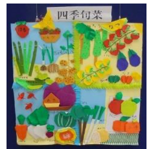
高根沢町児童館 きのこのもり 「四季旬菜」