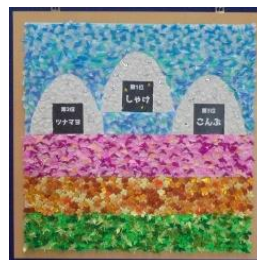
高根沢町 児童館みんなのひろば 「大きなおにぎり 「いただきます。！！」