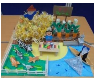
栃木市 さくら3Jホール 「私たちの食卓がで きるまで」