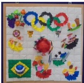
下野市 南河内児童館 「たくさん食べて オリンピックへGO」