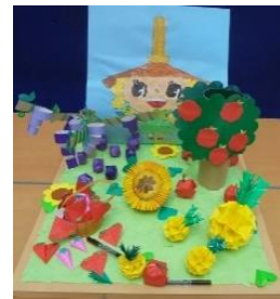
野木町 あかつか児童センター 「フルーツ大好き！ あかつか児童センター っ子」

児童館が参加しました。「食」の起源を表現したものや身近な食べ物、そして今はやりのPOPまで、幅広く楽しい作品が集まりました。 参加児童館の皆さまの多大なるご協力を心より感謝申し上げます。 次年度もたくさんの児童館の参加をお待ちしております。