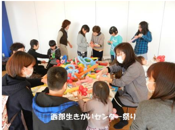
西部生きがいセンター祭り