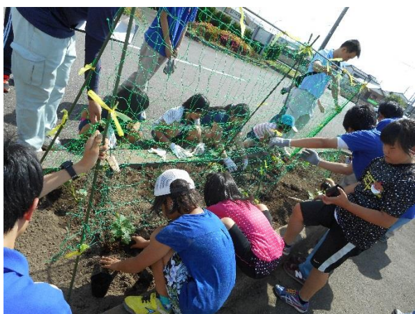
☆花壇作り～夏やさいを育てよう～☆