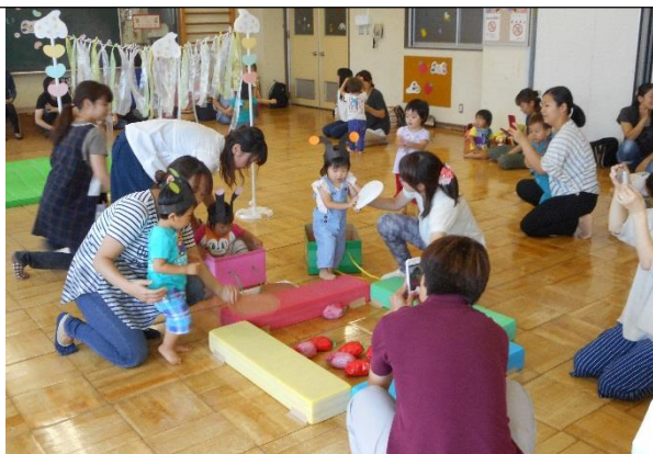
☆ママといっしょ 「ちびっこ運動会」☆