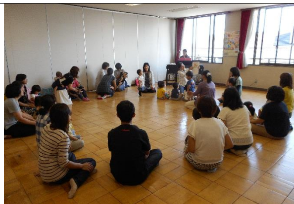
☆リトミックワールド☆