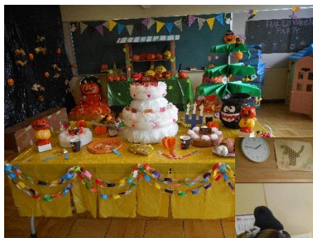
☆じどうかんまつり☆ ハロウィンパーティー